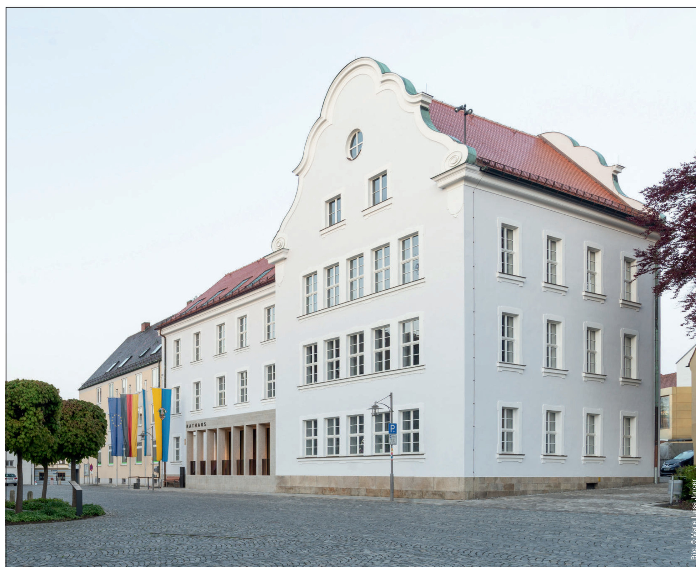
Saniertes Rathaus Waldsassen, Architekt Brückner & Brückner Tirschenreuth