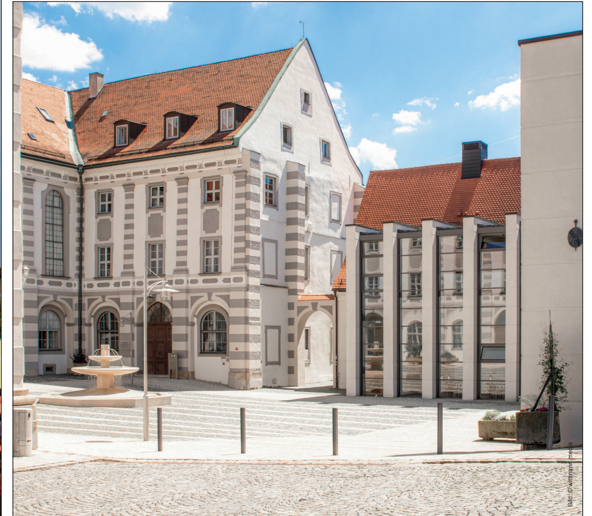
Generalsaniertes Kloster mit Gästehaus St. Joseph